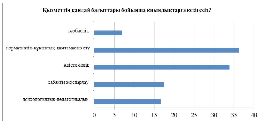
Сурет 3 – Білім беру қызметінің бағыттары бойынша тыңдаушыларда бар қиындықтар

Тыңдаушыларда білім беру қызметінің келесі бағыттарында қиындықтар басым: нормативтік-құқықтық бағытта – 36,18 % (8 679 адам), әдістемелік бағытта – 33,91 % (18 135 адам), сабақты жоспарлауда – 14,4 % (4 173 адам) және психологиялық-педагогикалық бағытта – 16,69 % (4 003 адам) (3-сурет):