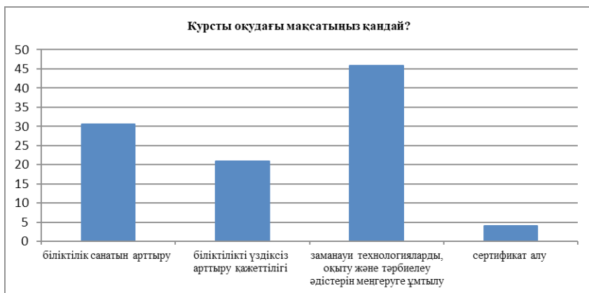
Сурет 1 – Тыңдаушыларды оқытудың негізгі мақсаттары

45,89 % (11 007 адам), біліктілік санатын көтеруді – 30,67 % (7 357 адам) таңдады (1-сурет):