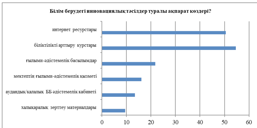
Сурет 4 – Білім берудегі инновациялық тәсілдер туралы ақпараттың негізгі көздері

Білім берудегі инновациялық тәсілдер туралы ақпараттың негізгі көздері ретінде тыңдаушылар біліктілікті арттыру курстарын (54,63 %) және интернет – ресурстарды (50,58 %) (4-сурет) атап өтті: