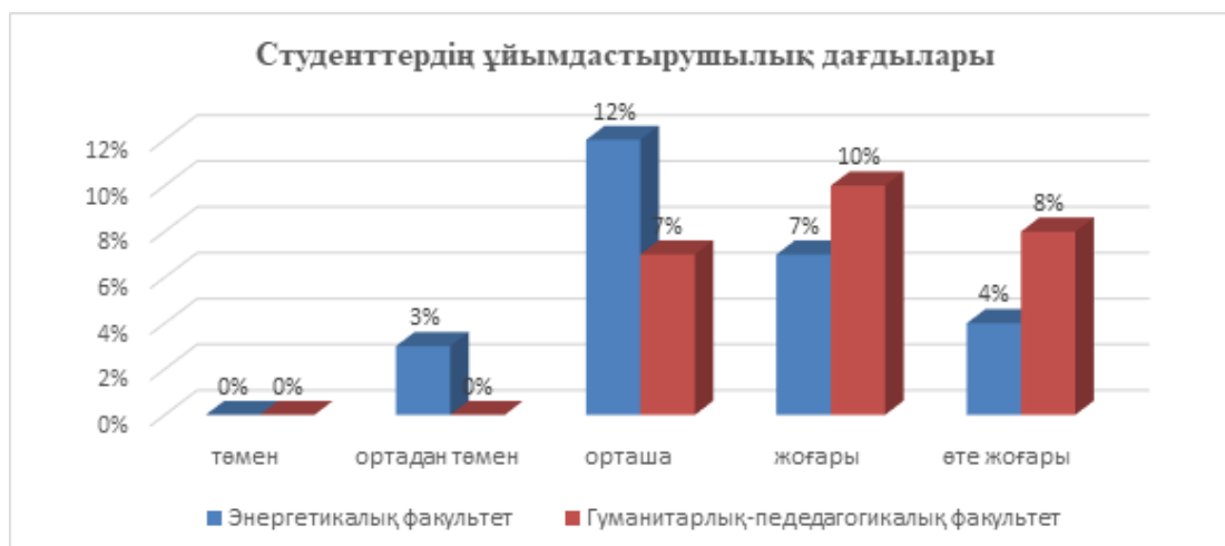
Сурет 2. Студенттердің ұйымдастырушылық дағдылары

«Коммуникативтік және ұйымдастырушылық бейімділік» әдістемесінің нәтижелерін тарқататын болсақ, студенттердің коммуникативтік және ұйымдастырушылық дағдыларын анықтау нәтижелері энергетика факультетінің студенттеріне қарағанда гуманитарлық-педагогикалық факультетінің студенттерінде жоғары. Гуманитарлық-педагогикалық факультетінде оқитын студенттердің коммуникативтік және ұйымдастырушылық дағдылары жоғары. Бұл бірнеше себептерге байланысты. Біріншіден, студенттердің білім алу мамандықтарының ерекшеліктеріне байланысты. Екіншіден, білім алу барысында басты дамытылатын қасиеттер мен икемділіктер тұлғаның қалыптасуына өзінің әсерін қалдыратыны дәлелденілді.