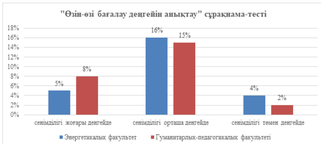
Сурет – 3. «Өзін-өзі бағалау деңгейін анықтау» әдістемесі