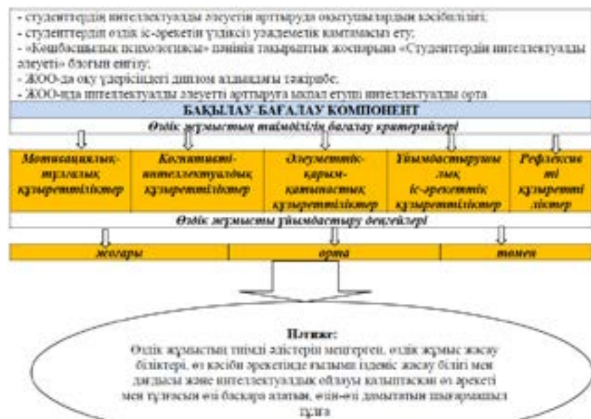
Сурет 1 – Студенттердің интеллектуалды әлеуетін арттыру үдерісінде өздік жұмысты ұйымдастырудың теориялық моделі

Ұйымдастырушылық-іс-әрекеттік компоненті студенттердің интеллектуалды әлеуетін арттыру үдерісінде өздік жұмысты ұйымдастыруды жүзеге асыру кезеңдерінен (мотивациялық, ұйымдастырушылық, атқарушылық, рефлексивті, бақылаушы) тұрады.