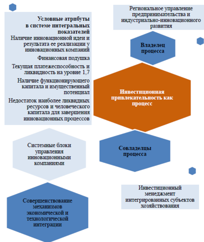
Рисунок 2 – Инструментализация инвестиционной привлекательности региона [8–9]

макросреды к построению эффективных технологических сетей на уровне регионов (рисунок 2).